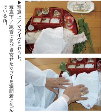
▶写真上/マブイグミセット。写真下/線香とおびき寄せたマブイを密着に包んでいる所。

沖縄では「人」には七つのマブイ(魂)がついていると言われていて、驚いた時や事故や病気になった時に簡単に落ちてしまうのがマブイの特徴で、特に子供はマブイと体の密着性が弱い事からマブイが抜けやすいとも言われています。マブイが一つでも落ちてしまうと、熱が出たり、強い倦怠感でやる気が起きない等、風邪に似た症状ではあります。薬が効かないことでマブイ脱落判断をします。では、落ちたマブイはどのようにするか。時間が経過する程マブイの酸化が進み、進行度でやさぐれマブイにも変化。とか。そんなマブイにしない為に、マブイが落ちたなと思ったら直ちにマブイ救出おまじないをする事が肝心です。