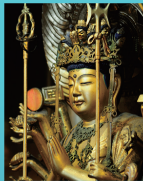
御本尊様は「千手観音菩薩」千本の手それぞれの掌に一眼をもつとされることから来ている

この守り本尊とは、生まれた年の干支の守護神で、主に本人や家族の御本尊に参拝します。おなじみの寺院の他に、自分の守り本尊が祀られている寺院も巡ってみては?