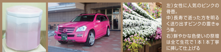
左) 女性に人気のピンクの骨壺。中) 長寿で逝った方を明るく送り出すピンクの霊きゅう車。右) 鮮やかな色使いの祭壇は全て生花で1本1本丁寧に挿して仕上げる

「印象的だったのが、当館で用意してあるピンクの霊きゅう車で出棺した時に、霊きゅう車の前でまるで家族同士で記念に残すように写真撮影が始まったことがあったんです。今までお疲れ様という感覚で、『さようなら』ではなく『次の世界に送り出す』という気持ちを感じられました。今までこういう光景を見たことがなかったので、新しい葬儀の形が見えたという気持ちになりました。」人生のうちで数ある通過儀礼の中でも、一番最後にやって来るのがお葬式。故人が空から笑って喜んでくれるような特別な式を作り上げていきたい。